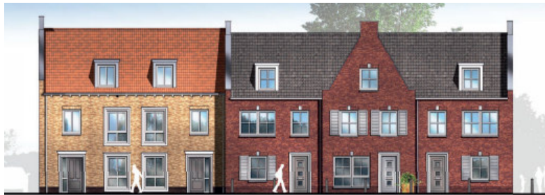
Blok 11 (bouwnummer 27 t/m 31)