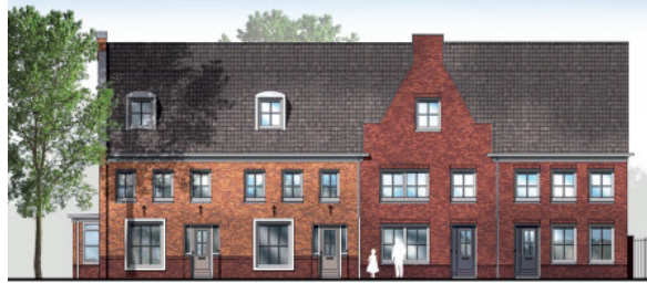
Blok 10 (bouwnummer 32 t/m 35)

Project 50 koopwoningen – fase 2B Dorpshart Hoef en Haag – type Meander Datum 03 mei 2018