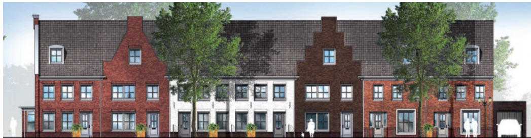
Blok 12 (bouwnummer 20 t/m 26)