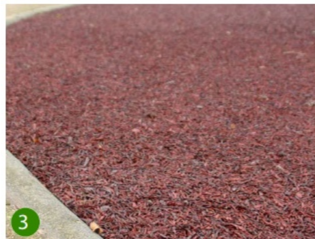
Evenwichtsbalk en stappalen met touw