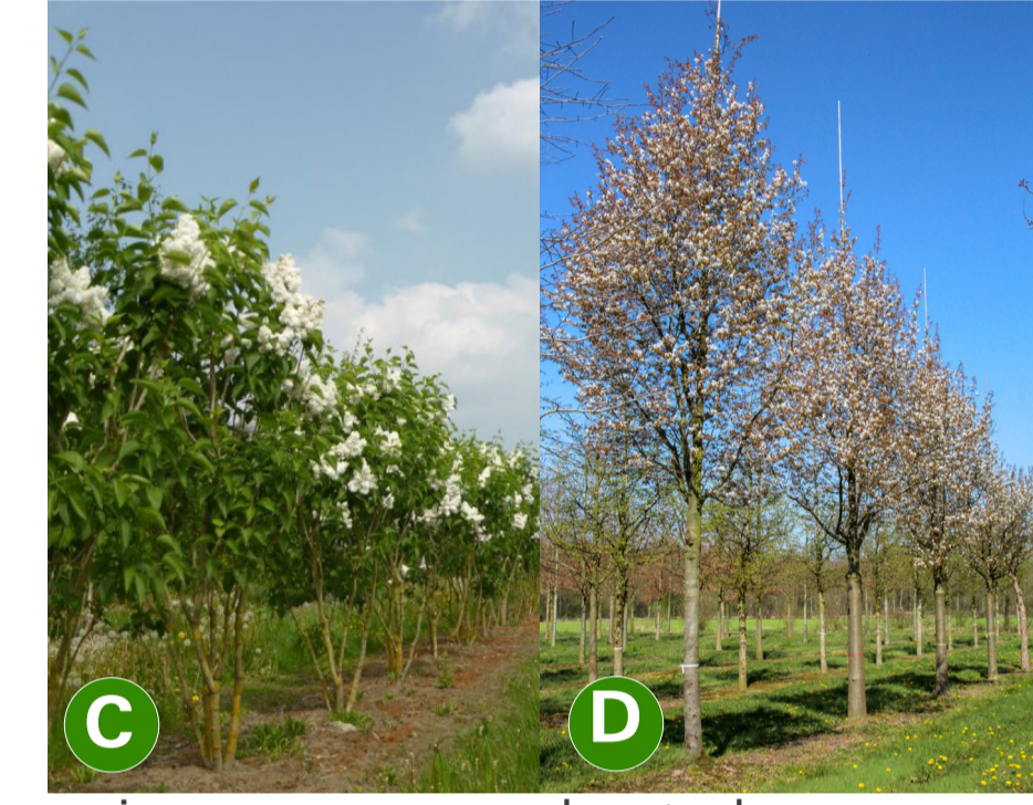
C sering cv D krentenboom cv