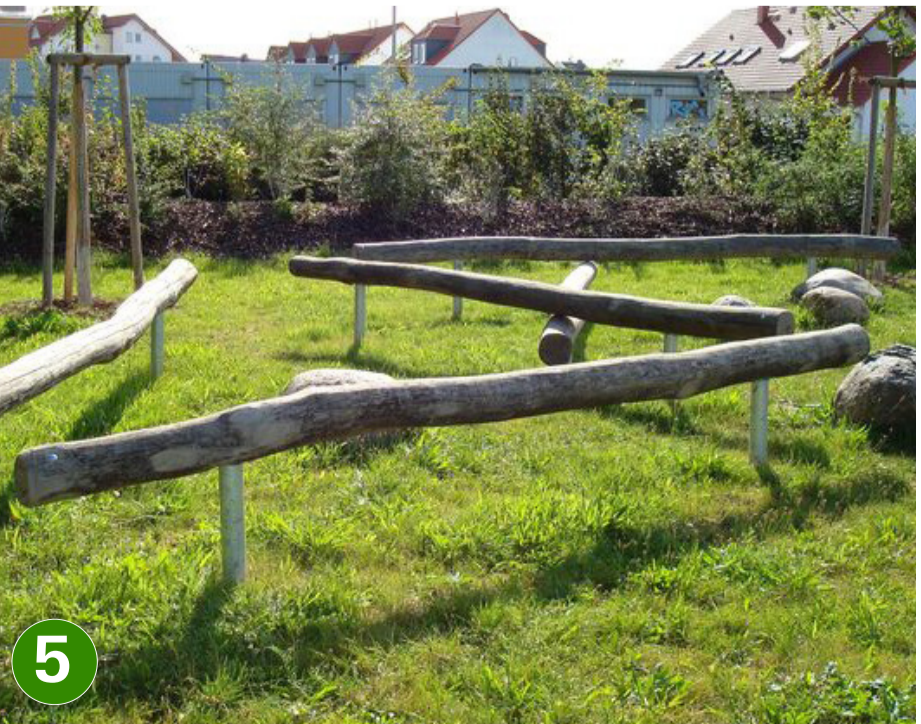
5 balanceerbalk 4m & 2m (Kinderland) (07-2703/2)