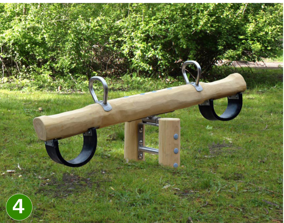
4 mini wipwap (Ziegler) (nr. 23.30.16.)