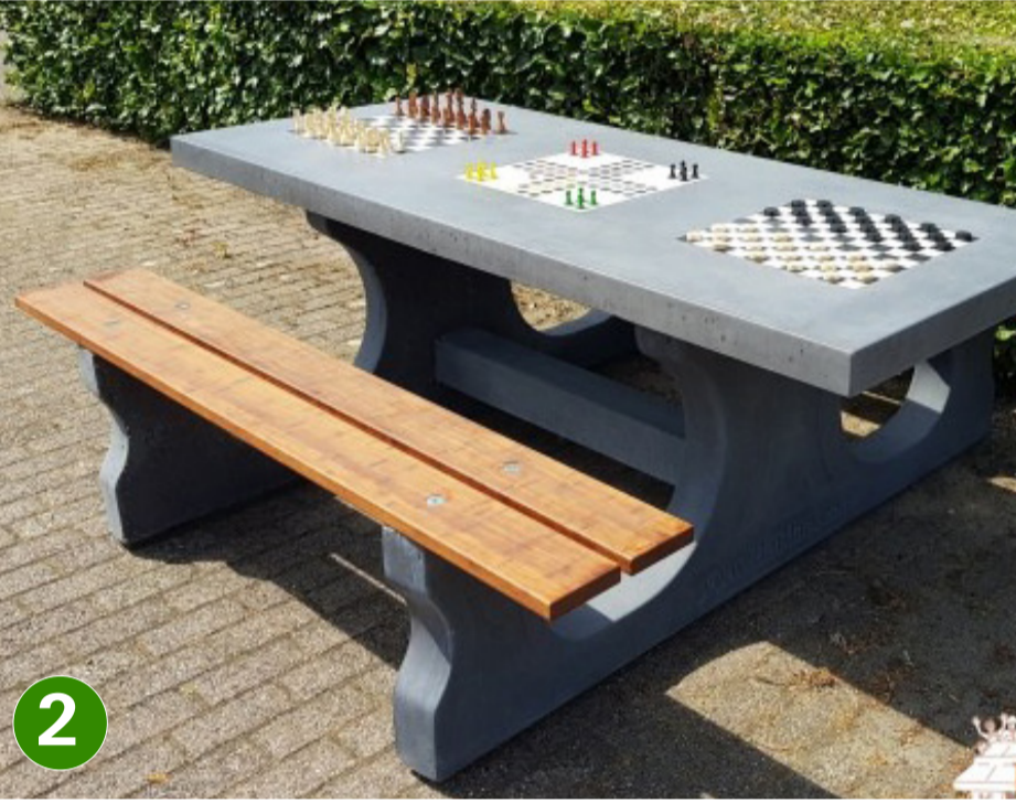
2 multi spellentafel (HeBlad) (PS DLAB GT 132)