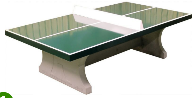
1 tafeltennistafel (HeBlad) (PS DLAB GT 132)