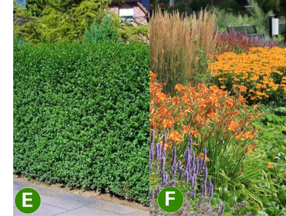
E ligusterhaag F vaste planten