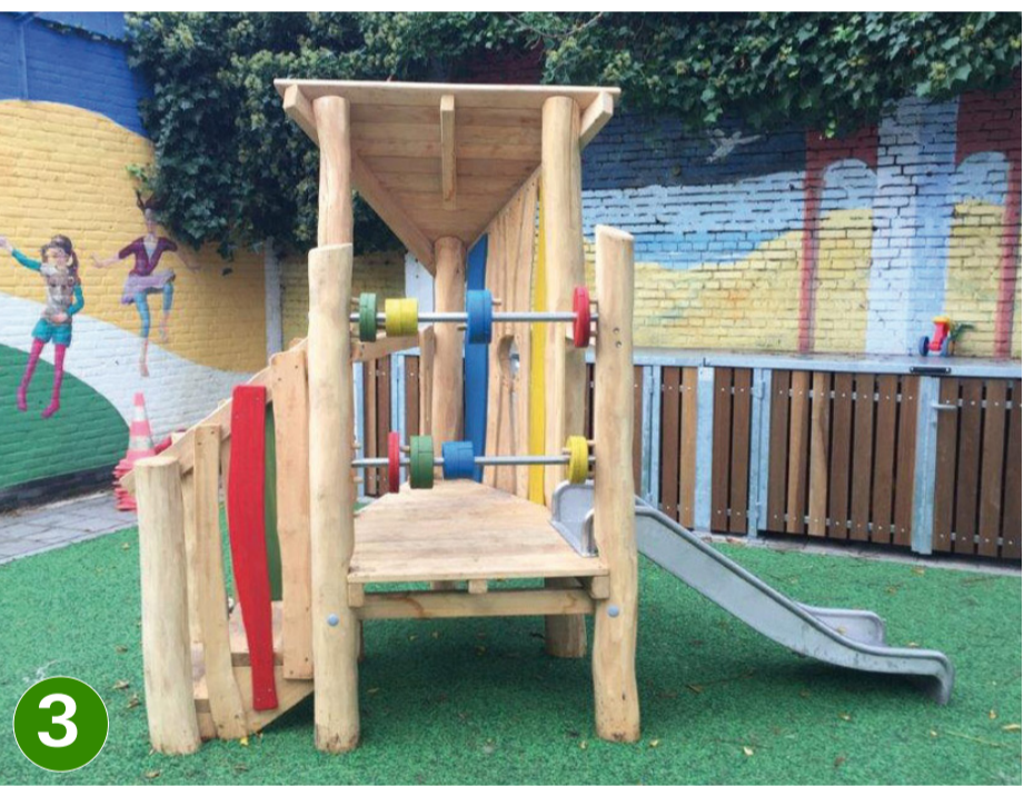
3 speeltoren met glijbaan (Ziegler) (nr.23.24)