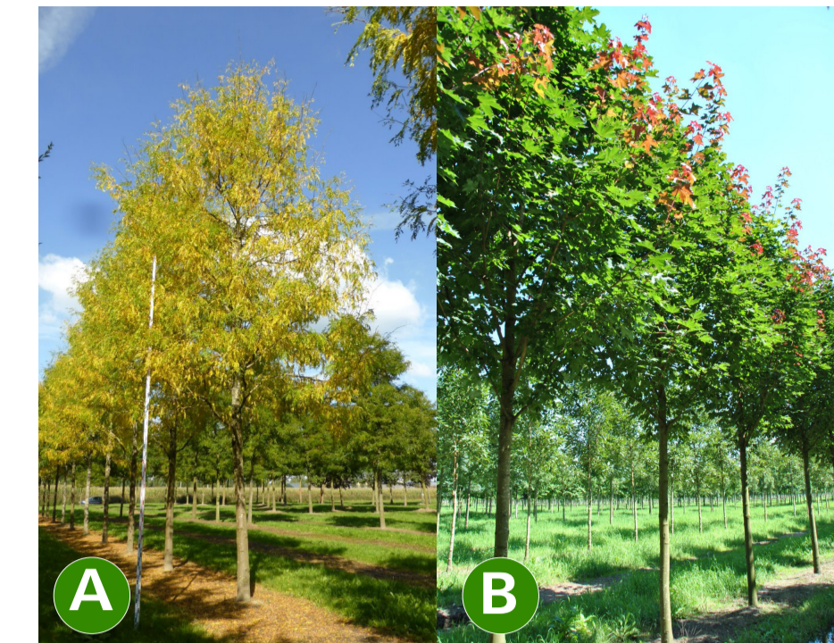
A valse christusdoorn cv B Noorse esdoorn cv